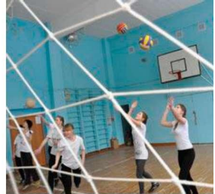
Фото 2.8. Спортивный зал

Производственное обучение и все виды практик проводятся на рабочих местах лучших предприятий и организаций общественного питания и торговли города.