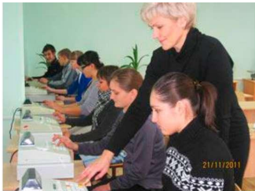
Фото 2.3. Лаборатория технического оснащения