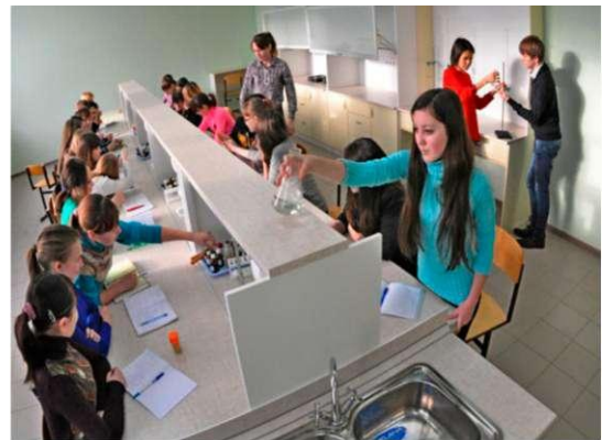
Фото 2.4. Лаборатория микробиологии и товароведения