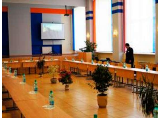
Фото 2.7. Актальный зал