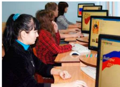
Фото 2.1. Компьютерные классы