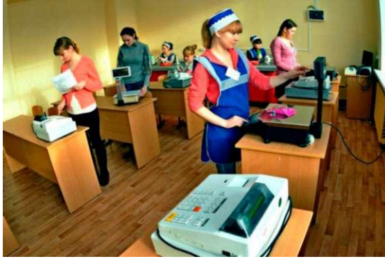
Фото 2.6. Учебный магазин