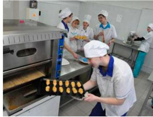
Фото 2.2. Технологические лаборатории